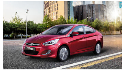
Hyundai Accent Blue