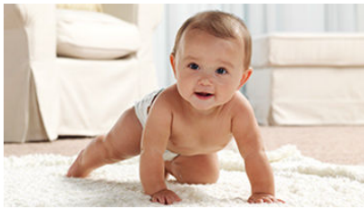
1 Yıllık Prima Kazanma Fırsatı!