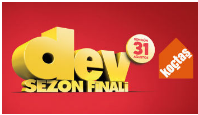
Koçtaş'ta Dev Sezon Finali