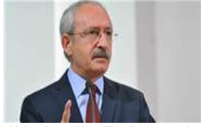
Kılıçdaroğlu: Toplum çok ağır bedelleri olur

Ağrı'nın Doğubayazıt ilçesinde jandarma karakoluna gece 03.00 sıralarında 2 ton patlayıcı yüklü traktörle intihar saldırısı düzenlenmişti. Saldırıda 2 asker şehit olurken, 24 asker de yaralanmıştı.