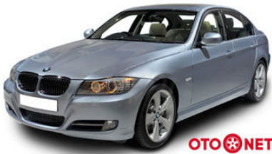
Al-Sat Kolayca Hallet