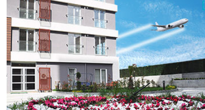
Home Aves Evleri Son Fırsat!

( http://www.radikal.com.tr/ibrahim_tatlis_yahu_ )