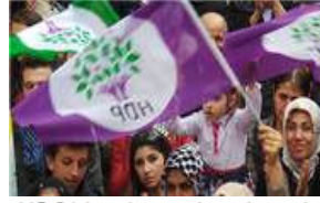
HDP'den 'topyekun barış' açıklaması