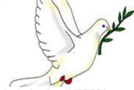
Aydınlardan 'YETER! Anaları ağlatmayın' çağrısı