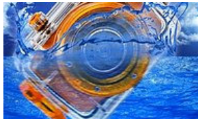
Her Yolculuğunuza Eşlik Etmesi İçin Tasarlanmış 11 Minik