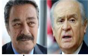
Kadir İnanır'dan Bahçeli'ye yanıt!