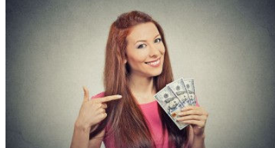
Ayda 3000TL Ek Maaş