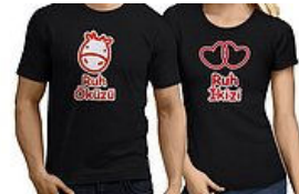
Aşkınizi Kelimelere Dökmek Yerine Üzerinizde Taşımanızı