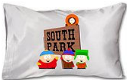
Sadece South Park Sevenlerin Çok İyi Bilmediği 10 Sahne

( http://app.medyanetads.com/redirect?ciid=577585&tid=4862&lid=0&led=0&publisher=radikal&URL=http%3A%2F%2Fwww.etstur.com%2FWater-Planet-Delux-Aquapark%3Futm_campaign%3DWater-Planet-Delux-Aquapark%26utm_medium%3DMedyanet%2FBanner%26utm_source%3Dradikal )