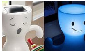
Çocukların Yüzüne Gülücük Üstüne Gülücük