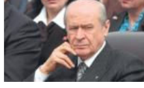
Bahçeli: Bu gidişatın sonu karalık