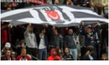
Olimpiyat'ta 17 gözaltı

YAZARLAR SİYASET TÜRKİYE DÜNYA EKONOMİ KÜLTÜR-SANAT ÇİZERLER SPOR YAŞAM BİLİM-TEKNIK SAĞLIK FOTOĞRAF VIDEO SOKAK GEZİ