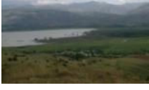
Sivas'ta köylülerin sopalı su nöbeti