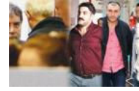
Ahmet Hakan'a saldıranlar AKP'li çıktı