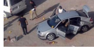
Bilanço ağırlaşıyor... Bir günde 5 şehit