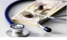
SGK tescil işlemleri devam ediyor