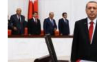
'Erdoğan kendisini hâlâ dünya lideri...