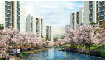
Sancaktepe'de Ev Fırsatı