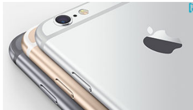
Forex ile iPhone Kazanın!