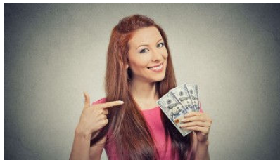
Ayda 3000TL Ek Maaş