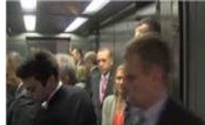
Erdoğan'dan asansör uyarısı: Birisi insin ya!