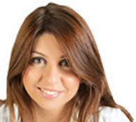
Bülent Arınç'ın 'dağı' ve "Biz Kürtler unutmuyoruz"