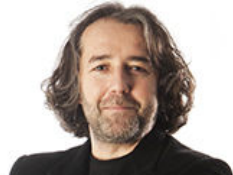
Kürtlerin tercihi Ruslar mı Amerikalılar mı?