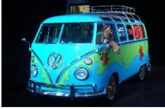
Los Angeles Otomobil Fuarı kapılarını açtı ( http://fotoanaliz.hurriyet.com.tr/galeridetay/98358 )