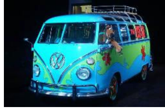
Los Angeles Otomobil Fuarı kapılarını açtı