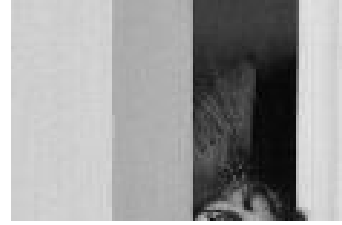
Bir şekilde bir yerlere sıkışmayı başarmış komik kediler