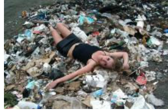
Poz vermeyi yanlış anlayanlar ( http://fotoanaliz.hurriyet.com.tr/galeridetay/98358 )