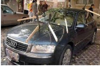
Aldatılan eşler hırslarını arabalardan aldı!