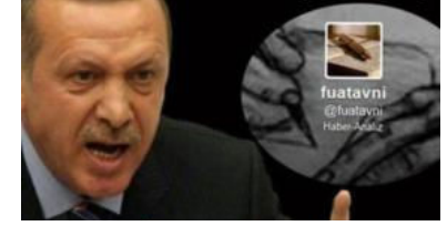
Erdoğan yalanlarken '1 milyar dolar' dedi