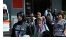
Soma ekmekle adalet arasında