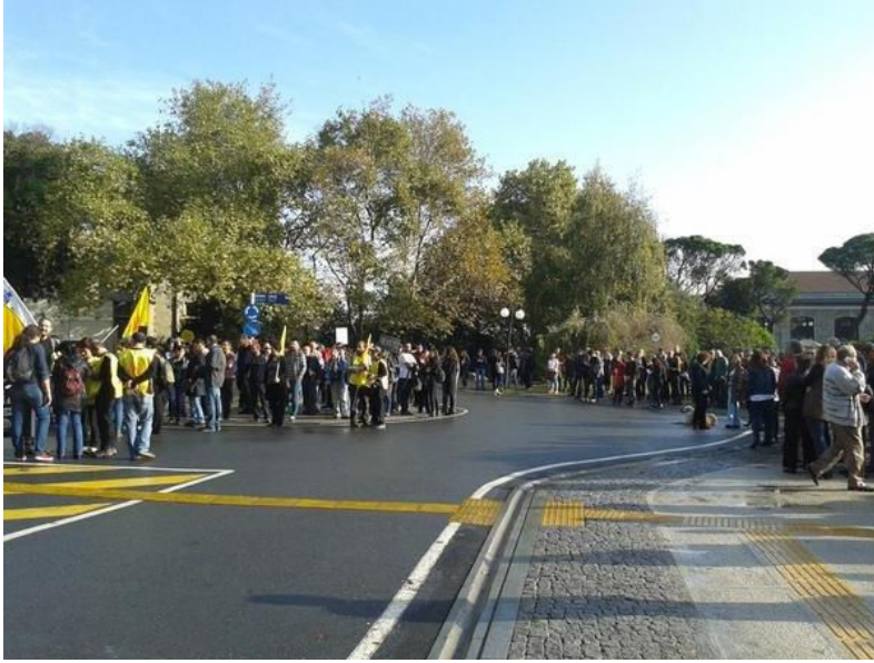
SAAT 10.20 Mimar Sinan Üniversitesi'nde boykot başladı.