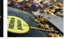
HDP'den akıl almaz iddia