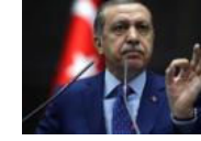
Ünlü anket şirketi Pew'den Erdoğan'ı...