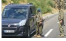
Tunceli Valiliği'nden kapatma kararı