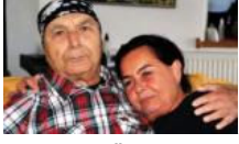
Memduh Ün hayatını kaybetti

YAZARLAR SİYASET TÜRKİYE DÜNYA EKONOMİ KÜLTÜR-SANAT ÇİZERLER SPOR YAŞAM BİLİM-TEKNİK SAĞLIK EĞİTİM FOTOĞRAF VİDEO SOKAK GEZİ