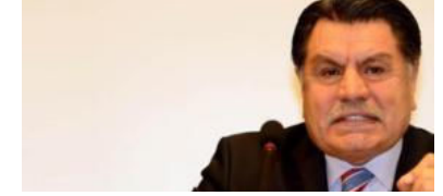
Hashim Kılıç'tan Erdoğan'ı küplere bindirecek konuşma