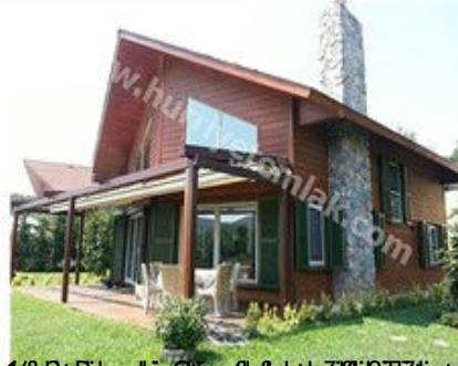
Kırklareli / Vize akıl Ev (http://www.hurriyetemlak.com)