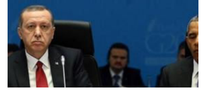
Dünya liderleri Erdoğan'ı teğet geçti... Obama sakız çiğnedi