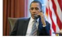
Obama'dan Davutoğlu'na tebrik telefonu