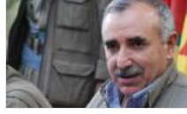
Karayılan'dan tehdit: Saldırın, misliyle yanıt alırsınız