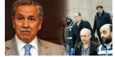
'Ülkenin namusunu kurtarmışsınız'