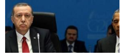
Dünya liderleri Erdoğan'ı teğet geçti... Obama sakız çiğnedi