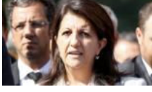
Pevrin Buldan: Barış sürecinin buzdolabından çıkması

YAZARLAR SİYASET TÜRKİYE DÜNYA EKONOMİ KÜLTÜR-SANAT ÇİZERLER SPOR YAŞAM BİLİM-TEKNİK SAĞLIK EĞİTİM FOTOĞRAF VİDEO SOKAK GEZİ