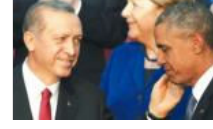
'Sevgili Barack'a jest