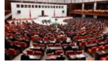
TBMM'de yemin töreni yarın