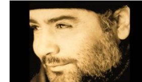
Üşür Ölüm Bile