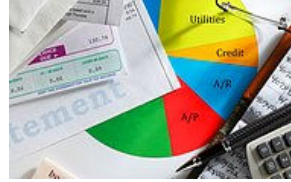
Girişimci Dostu Bir Ön Muhasebe Programının 10