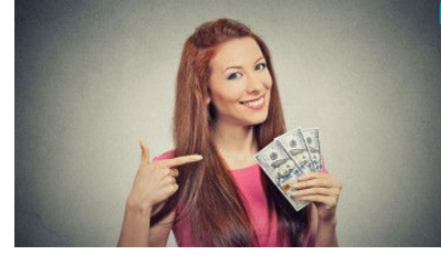
Ayda 3000TL Ek Maaş