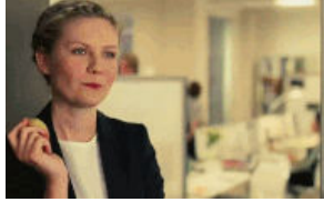
Hem Diyet Yapıp Hem de Ne Yesem Diye Düşünenlerin 10 Ortak

tid=15067&lid=26&led=4320&publisher=radikal&URL=http%3A%2F%2Fwww.trendyol.com%2FSoho-Exclusive---Kargo-Bedava%2FButikDetay%2F39797%3Futm_source%3Daff%26utm_medium%3Dmedyanet_cpc%26utm_campaign%3Dmedyanet_soho_16112015