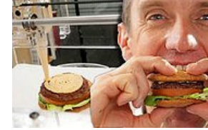
3D Yazıcılar Olmasaydı Yapamayacağımız 10