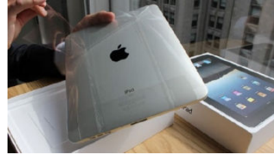
Satıcılar bundan hoşlanmaz