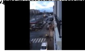
Saldırı sonrası yaşananlar böyle görüntülendi

Cizre'de silah sesleri altında bayrak operasyonu (http://webtv.radikal.com.tr/turkiye/16412/cizrede-