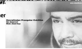
Hasretinden Prangalar Eskittim