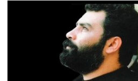
Acılara Tutunmak (http://webtv.radikal.com.tr)