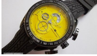
Porsche de Dev Kampanya