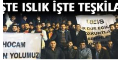
İşte ıslık işte teşkilat