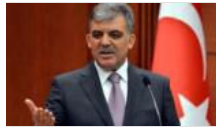
Abdullah Gül'ün acı günü