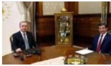
Cumhurbaşkanı Erdoğan, Başbakan Davutoğlu ile görüştü