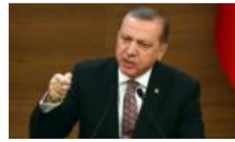
Erdoğan'dan Avrupa'ya 'kapıları açarız' tehdidi