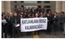
Avukatlar: Sessiz kalmayacağız