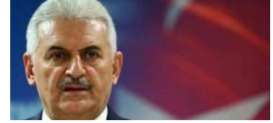
Başbakan açıkladı: Memurların yıllık izin yasağı kaldırılıyor mu?