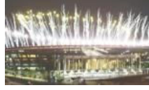
Olimpiyat ateşi Rio'da yanıyor