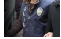
Cemaat içeri attı kimse çıkaramıyor