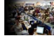
150 bin memurun işi tehlikede