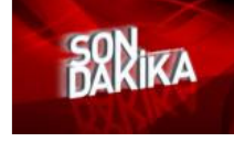
CHP'de olağanüstü Yenikapı toplantısı