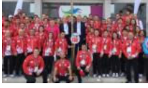
Olimpiyatlarda da Yunanistan ile komşuyuz

YAZARLAR SİYASET TÜRKİYE DÜNYA EKONOMİ KÜLTÜR-SANAT ÇİZERLER SPOR YAŞAM BİLİM-TEKNİK SAĞLIK EĞİTİM FOTOĞRAF VİDEO SOKAK GEZİ