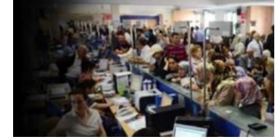
150 bin memurun işi tehlikede