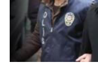
Cemaat içeri attı kimse çıkarıyormuş