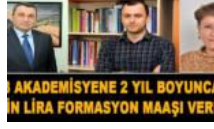
3 akademisyene 2 yıl boyunca 55'er bin lira formasyon maaşı