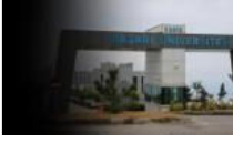
Öğrenci nereye taşınmazlar oraya