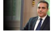
MİT'e tepki büyük... AKP Fidan'ı tartışıyor