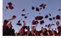
Öğrenciye burs fırsatı