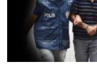
MİT'ten 20 bin kişilik yeni liste.....