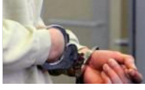
Darbe girişimi soruşturması kapsamında 3 asker