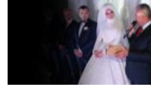
Başbakan'ın yeğenine 'sen de havaya girme' sözlerine kadınlardan