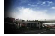
İstanbul'da bir kadın, kendisini taciz eden...