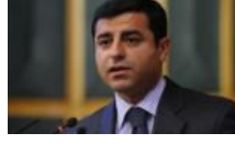
Demirtaş, Avrupa'ya gidiyor