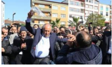
Muharrem İnce 'Cığoş' oynadı