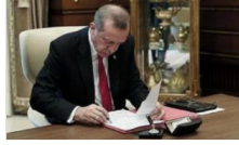
Atama kararları Resmi Gazete'de