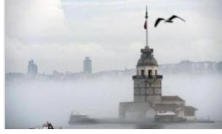
İstanbul'da yoğun sis: Bazı vapur seferleri iptal