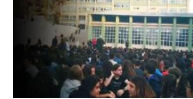
İkna odaları geri döndü