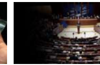
'Darbeyi anladık demokrasiye dön'