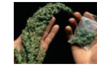
Türkiye'de 19 ilde kenevir yasallaştı