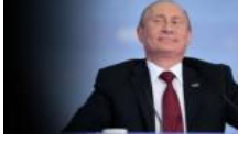
Putin, Twitter'da ABD Başkanı oldu