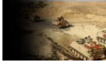
Irak Bölgesel Kürt Parlamentosu vekili: PKK Musul