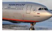
Cenevre'de uçakta bomba alarmı... Uçak acil iniş yaptı