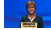
İskoçya ikinci bağımsızlık referandumuna