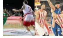
Anadolu Efes ve Darüşşafaka Doğuş Euroleague'de