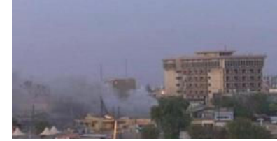
İŞİD'in uyuyan hücreleri harekete geçti