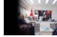
En az oyu aldığı halde seçilmenin bedeli:...