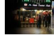
Tarihi Eminönü Balıkçısı'nın...