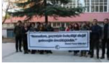
Ahmet Taner Kışlalı fakültesinde anıldı