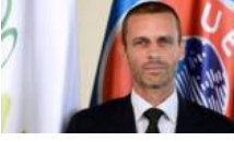
Şampiyonlar Ligi için çılgin plan

YAZARLAR SİYASET TÜRKİYE DÜNYA EKONOMİ KÜLTÜR-SANAT ÇİZERLER SPOR YAŞAM TEKNOLOJİ SAĞLIK EĞİTİM FOTOĞRAF VIDEO SOKAK GEZİ