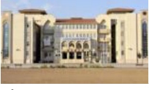
İmam Hatip Ortaokulu Müdür Yardımcısı oyun oynayan öğrencileri

YAZARLAR SİYASET TÜRKİYE DÜNYA EKONOMİ KÜLTÜR-SANAT ÇİZERLER SPOR YAŞAM TEKNOLOJİ SAĞLIK EĞİTİM FOTOĞRAF VIDEO SOKAK GEZİ