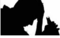
Kaçak içkilere dikkat: Zehirlenmeler arttı