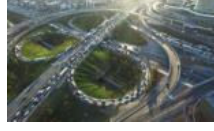
Mahmutbey kavşağında trafik yoğunluğu artarak