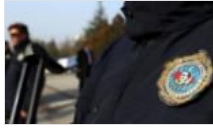
Darbe girişiminden sonra ihraç edilen MİT ajanı kayıp