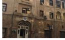
Mersin Büyükşehir Belediyesi'ne operasyon: Gözaltılar