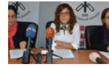
Kadına şiddet bitmiyor