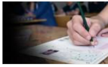
TEOG'da hatalı soru iddiası