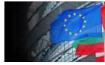
Avrupa ile ihracatta çember daralıyor