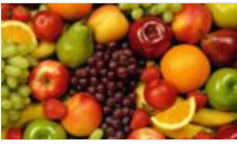
Yaş meyve ve sebze Rusya krizinin faturası belli oldu: 503 milyon