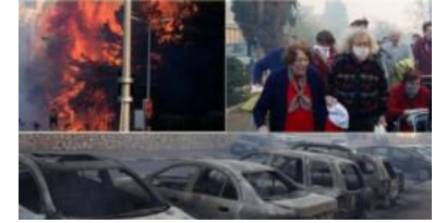
İsrail yanıyor: On binlerce kişi kaçıyor