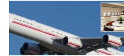
Erdoğan için devrik diktatörün uçağı satın alındı... 78 milyon dolar ödendi