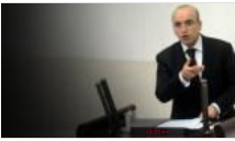
Mehmet Şimşek: 2017'de her 100 liranın 11TL'si faize gidecek