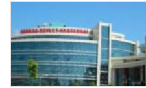
Sakarya'da hastane karantinaya alındı