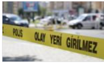
Mersin'de iş cinayeti: İnşaattan düşen işçi öldü