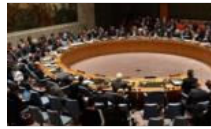
Rusya ve Çin'den Halep vetosu