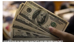
Forex'te hangisine yatırım