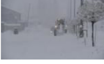
Van'da okullara kar tatili