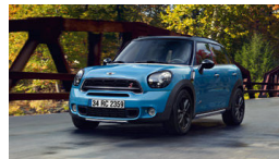
Ayda 1.699 TL ödeme fırsatı