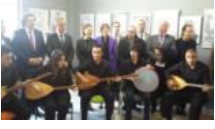
Ataşehir Güzel Sanatlar Lisesi Yenilendi

YAZARLAR GÜNDEM SİYASET TÜRKİYE DÜNYA EKONOMİ KÜLTÜR-SANAT ÇİZERLER SPOR YAŞAM TEKNOLOJİ EĞİTİM FOTOĞRAF VIDEO ENGLISH