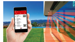
Hırsızlığa Karşı Evinizi