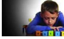
Otizimli çocukları kaliteli eğitim bekliyor