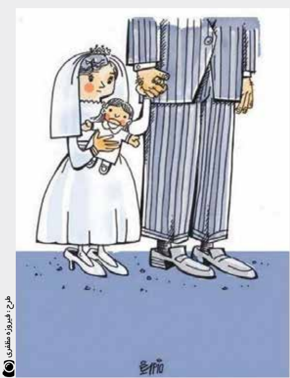
طرح فیهروزه عفتلی

حرکتی نتیجه مثبت خودش را دارد حتی ازدواج در سن ۱۳ سال اما همه می‌دانند که کارکرد مثبت ازدواج در این سن از کارکرد منفی آن بسیار کمتر است. بخارایی همچنین پیش‌بینی می‌کند که مراجع بیشتری پشت سر آیت الله «مکارم شیرازی» برای افزایش سن ازدواج و تغییر قانونی که ازدواج را از ۱۳ سال به بالا تعیین کرده است، قرار بگیرند.یک سر دفتر هم در گفت‌وگو با «ایران» ازدواج در سن ۱۳ سال را مختص خانواده‌های فقیر و آسیب دیده نمی‌داند و می‌گوید:«من خودم چند روز پیش عقد یک دختر خانم ۱۳ ساله را خواندم که از خانواده‌ای میلیاردی بود.»