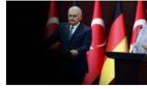
Merkel: Güçler ayrılığının ne kadar önemli olduğunun