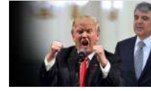
Trump'ın kararına hükümet sessiz kaldı, Abdullah Gül'den