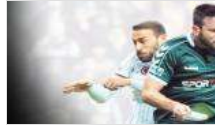
Kulüpleri kızdıran kur indirim Meclis'te