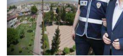
Şarkıya örgüt üyeliği... Gesi Bağları'na 15, haberi yapana 3 yıl