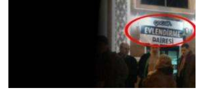
Müftülük tabelasına çocuk evlendirme dairesi yazısı asıldı