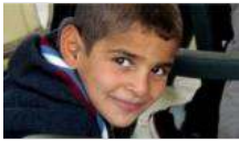
Dünya Bankası Türkiye'deki sığınmacılar için okul