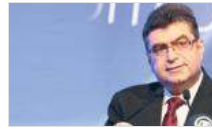
MEB Bakan Yardımcısı'ndan 'boşluğu doldurun'