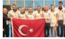
Türkiye Portekiz'i geçti