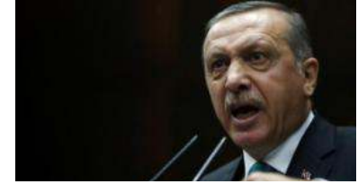
Sertliği Erdoğan istiyor