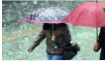
Meteoroloji'den yağış uyarısı