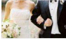
Yurt dışında boşanan Türkiye'de de boşanmış sayılacak