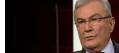
Baykal'dan yol haritası: Kılıçdaroğlu koltuğu cumhurbaşkanı adayına bırakmalı