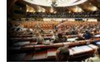
AKPM'de oylama günü: Ankara'nın işi...