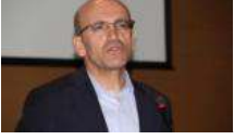
Bild: Mehmet Şimşek Almanya'dan yardım talep etti

YAZARLAR GÜNDEM SİYASET TÜRKİYE DÜNYA EKONOMİ KÜLTÜR-SANAT ÇİZERLER SPOR YAŞAM TEKNOLOJİ EĞİTİM FOTOĞRAF VIDEO ENGLISH