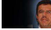
Bakan Zeybekci: Algi kötü, Türkiye ilk fırsatta OHAL'den kurtulmalı