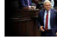
Yıldırım koltuğu bırakmaya hazır