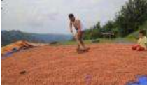
TMO fındık alımına başladı