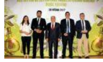
Zeytinyağı ihracatında rekor artış