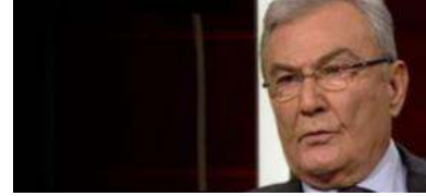
Baykal'dan yol haritası: Kılıçdaroğlu koltuğu cumhurbaşkanı adayına bırakmalı