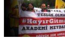
Akademide dayanışma büyüyor