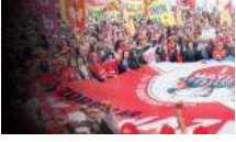
HAYIR daha bitmedi

YAZARLAR GÜNDEM SİYASET TÜRKİYE DÜNYA EKONOMİ KÜLTÜR-SANAT ÇİZERLER SPOR YAŞAM TEKNOLOJİ EĞİTİM FOTOĞRAF VIDEO ENGLISH