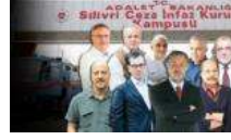
Ülkenin düşürüldüğü durumdan rahatsızlar