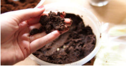
İstenmeyen Tüylere Kahve Telvesi İle Veda Edin!