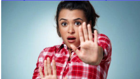
Her Gün Yaptığınız Bu Alışkanlıklardan Vazgeçin!