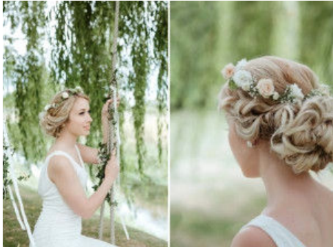
Kır Düğünlerinin En Popüler Saç Aksesuarları