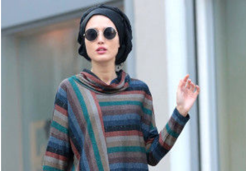
Tesettürde Yaz Modası: Renkli Çizgi Desenler