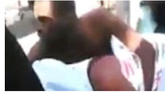
Cinsel İlişki Sırasında Kilitli Kalan Çift Sedyeye Üstünde Hastaneye Taşındı