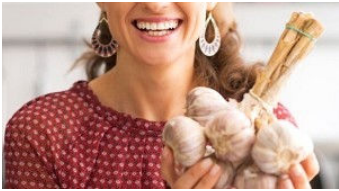
Sarımsak Yemek Kanserden Korur Mu?