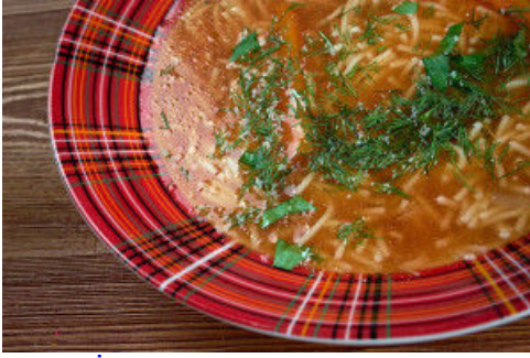
Günün İftar Menüsü