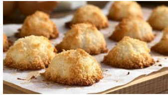
Üç Malzemeli Şipşak Kurabiye Tarifi