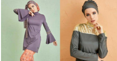
Sezonun En Popüler Tesettür Mayo Tasarımları