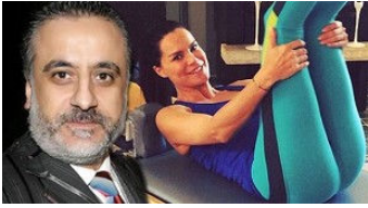
Ebru Şallı'ya Ait Olduğu İddia Edilen Çıplak Fotoğrafı Erol Köse Sansürlü Paylaşmış