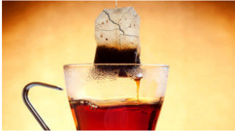
Poşet Çayı Buzdolabına Koyunca Bakın Ne Oluyor!