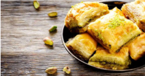
Ramazan Tatlıları Kaç Kalori?