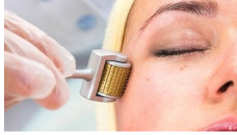
En Tuhaf Güzellik Aletleri