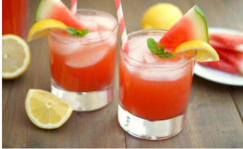
Karpuzlu Limonata Nasıl Yapılır?