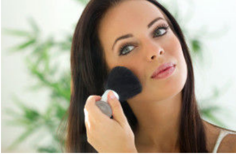
Ten Rengine Göre En Doğru Bronzer Seçimi