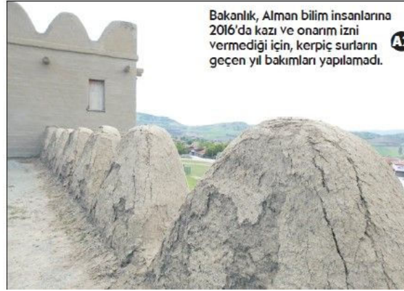
Bakanlık, Alman bilim insanlarına 2016'da kazı ve onarım izni vermediği için, kerpiç surların geçen yıl bakımları yapılamadı.