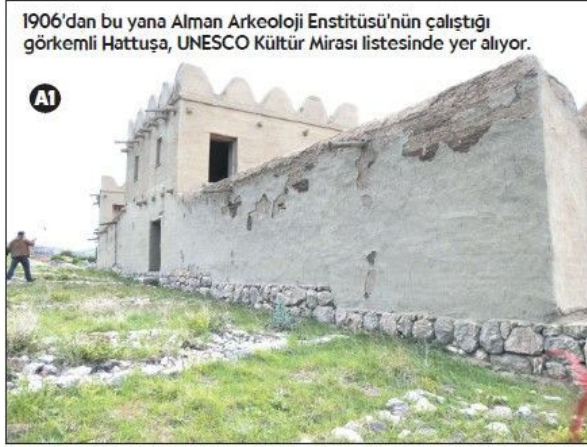
1906'dan bu yana Alman Arkeoloji Enstitüsü'nün çalıştığı görkemli Hattuşa, UNESCO Kültür Mirası listesinde yer alıyor.

Bu eşsiz tarihsel yerleri görmek için, Çorum'a önceki yıl 25 binden fazla yabancı turist gelmiş... Ancak terör korkusu ve "Avrupa ülkelerini dışlama siyaseti sonucunda", geçen yıl yabancı turist sayısı 2 bine inmişti! Oteller ve lokantalar boştu. Bu nedenle bu tesislerde çalışanların pek çoğunun işlerine de son verilmişti.