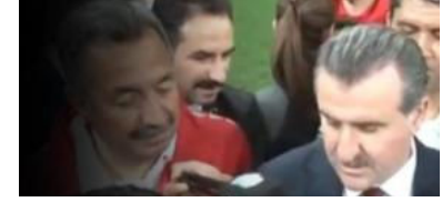
Erdoğan canlı yayında 'Beşiktaş mı yaptı o stadi ya' diye fırladı, Bakan mikrofonu...