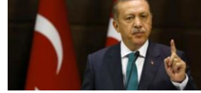
Gökçek'in istifası kararının ardından Erdoğan'dan jet açıklama