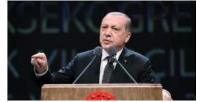
Erdoğan'dan yeni 'istifa' talimatı