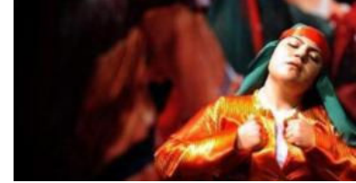
Aleviler tepkili: Sıra bize geldi