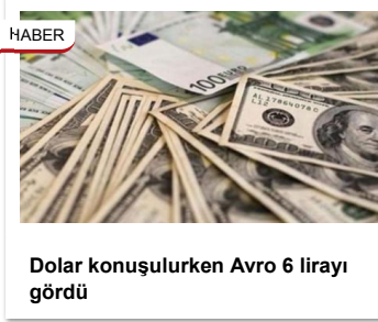
Dolar konuşulurken Avro 6 lirayı gördü