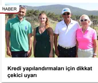
Kredi yapılandırılmaları için dikkat çekici uyarı