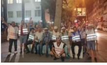
İstanbul'a yürüyen Cargill işçileri serbest birakıldı