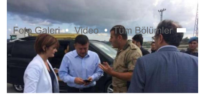
'29 Ekim'e yetişmeyecek'