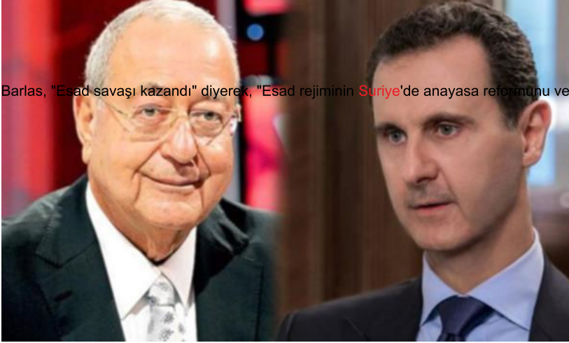
Barlas, "Esad savaşı kazandı" diyerek, "Esad rejiminin Suriye'de anayasa reformunu ve

seçimleri yapmasını amaçlayan çalışmalarına katkıda bulunmalıyız" ifadesini kullandı.