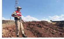
Siverek'te temel kazısında patlamamış obüs mühimmatı