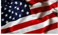
ABD'den son dakika İdlib açıklaması