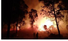
İzmir'de korkutan yangın