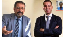
Başkente 3 grup yarışıyor