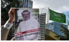
NYT'dan önemli Kaşıkçı iddiası: istihbarat yetkilisi sorumlu