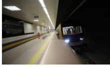
Üsküdar-Ümraniye- Çekmeköy metrosu Pazar günü açılıyor