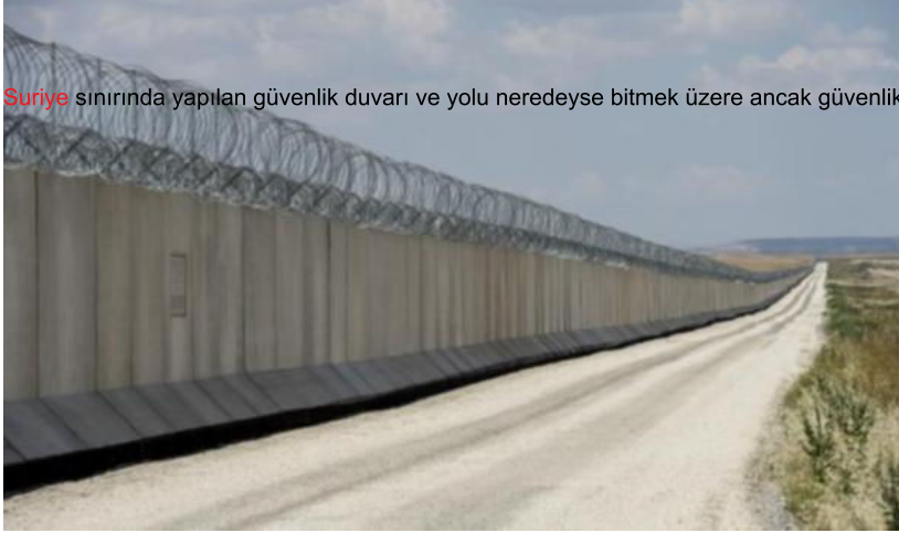
Suriye sınırında yapılan güvenlik duvarı ve yolu neredeyse bitmek üzere ancak güvenlik

gerekçeleriyle çalışmalar yavaş ilerliyor.