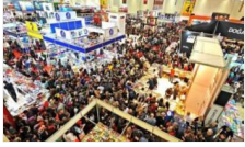
37. Uluslararası İstanbul Kitap Fuarı etkinlik programı