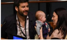
Yeni Zelanda Başbakanı Jacinda Ardern, BM oturumuna