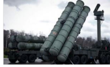
ABD Dışişleri: Suriye'ye S-300 teslimi, koalisyon için riskleri artırır