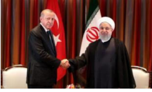
Erdoğan, Ruhani ile görüştü