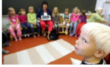
Zengin ve fakire eşit fırsat tanıyan Finlandiya eğitim