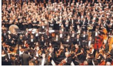
Tekfen Filar-Mini'den çocuklara