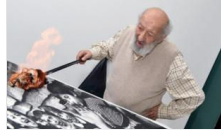
Anadolu belleğini yitirdi