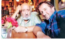
'Atatürk'ün sandalına takılırmış'