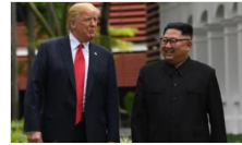
Kore'de ABD çelmesi