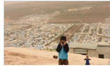
İdlib için süre uzatılıyor