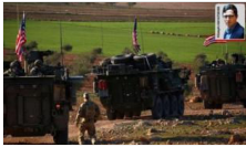
ABD ile 'Mınbiç' pazarlığı