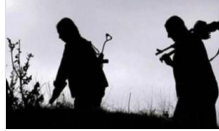
Koruculara silah ruhsatı