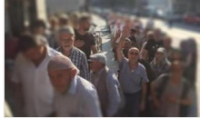
Emeklilikte yaşa takılanlar için yasa çıkacak mı? Başkan