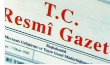
Cumhurbaşkanı kararı Resmî Gazete'de