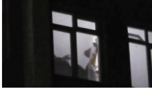
Yatılı okulda kan donduran olay