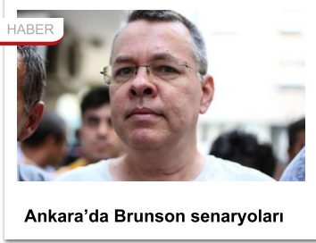
Ankara'da Brunson senaryoları