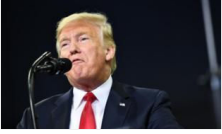
Trump: Sınırı kapatır, asker yığarım