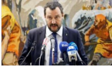
İtalya'da 'radikal İslamcı' oldukları gerekçesiyle sınır dışı