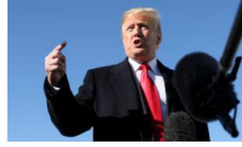
Trump: Kaşıkçı kesinlikle ölmüşse benziyor