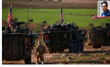
ABD ile 'Mınbiç' pazarlığı