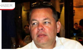
Duruşma öncesi Brunson'a kritik ziyaret