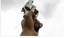
İstanbul Valiliği'nden 'maganda' uyarısı