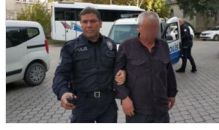
Kafede içecek kavgası: 1 kişi bıçakla yaralandı