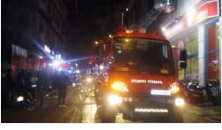
Kadıköy'deki fastfood zincirinde yangın

Yazarlar Gündem Siyaset Türkiye Dünya Ekonomi Kültür-Sanat Çizerler Spor Yaşam Bilim ve Teknoloji Eğitim Sağlık Fotoğraf Video