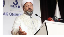
Diyanet İşleri Başkanı Erbaş'tan deizm açıklaması