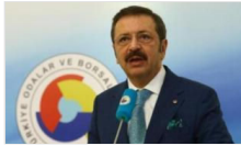
TOBB Başkanı Hisarcıklıoğlu: Devlet alacağına şahin,