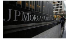
JP Morgan'dan ÖTV- KDV indirimi yorumu

Ana Sayfa Ekonomi 'Firmalar ikramları durdurdu, servisler ücretli olacak'