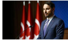
Finansal İstikrar ve Kalkınma Komitesi'nin ilk toplantısı