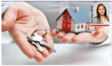
Konuta yatırım durdu