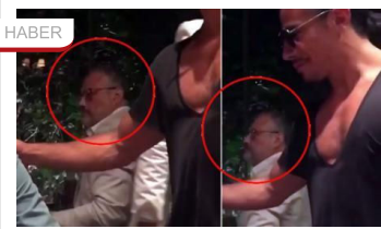
Kaşıkçı'nın öldürülmeden 15 gün önceki görüntüleri ortaya çıktı