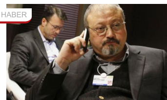
"Kaşıkçı'nın cesedi parçalanarak yok edilmiştir"