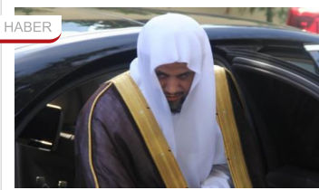
Cesedi asitle eritmişler